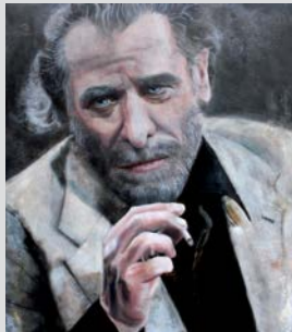
Charles Bukowski 2019 | Öl auf Leinwand | 180 x 160 cm