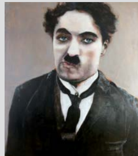
Charlie Chaplin 2018 | Öl auf Leinwand | 180 x 160 cm