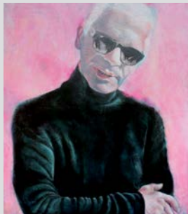
Karl Lagerfeld 2019 | Öl auf Leinwand | 140 x 120 cm