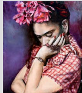
Frida Kahlo 2018 | Öl auf Leinwand | 180 x 160 cm