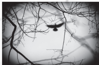
„Komm, großer schwarzer Vogel.“ – 40 x 60 cm

Titelbild (Ausschnitt): „Ich bin auf einem dunklen Weg.“ – 80 x 120 cm