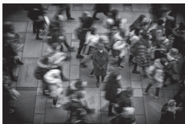
„Ich bin allen egal.“ – 80 x 120 cm

Die Bilder zeigen die „dunklen Gedanken“ depressiver Menschen – umgesetzt in düsteren Fotografien in strengem Schwarz-Weiß. Die starke Vignettierung der Bilder steht für den eingeschränkten und verengten Blick auf die Realität, der mit dieser Krankheit einhergeht. Die Fotografien sind nicht nur eine künstlerische Auseinandersetzung mit diesem schwierigen Thema, sondern sollen in den Begleittexten auch Aufklärung und Anleitung für Betroffene und Angehörige bieten. Die fotografische Umsetzung dieser noch immer tabuisierten Form einer psychischen Erkrankung soll aufklären und bei Betroffenheit – ob selbst oder als Angehörige:r – auf Hilfsmöglichkeiten hinweisen.