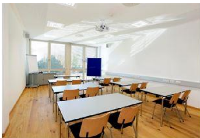
Raum Hauser Kaibling

Hier klicken: Virtueller Rundgang Steiermarkhof