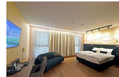
Doppelzimmer Deluxe mit Couch