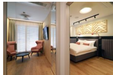
Wohnbereich in der Suite